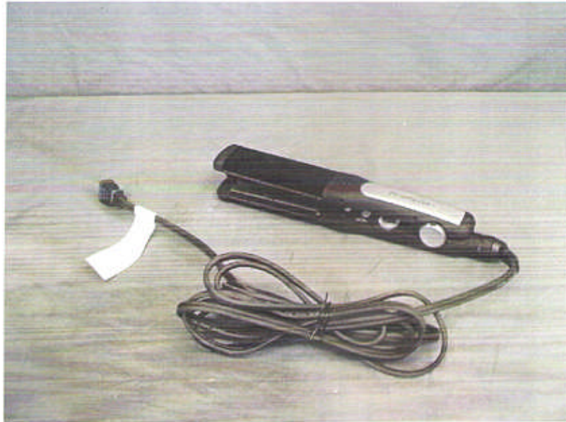
Pro styling Care+ (PSC3869RJ) 外觀写真 (2)